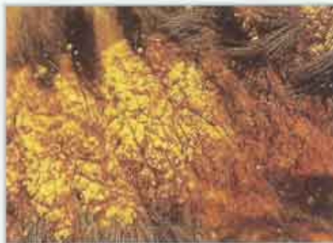
Aspecto general y detalle de la dermatosis con respuesta a la VIT A

3. Zinc (480mg) para el tratamiento de la dermatosis con respuesta al zinc síndrome I (adultos, típica de razas nórdicas, dermatosis facial y hiperqueratosis, tratamiento para el resto de la vida) y síndrome II (cachorros de crecimiento rápido, descamación, tratamiento transitorio).