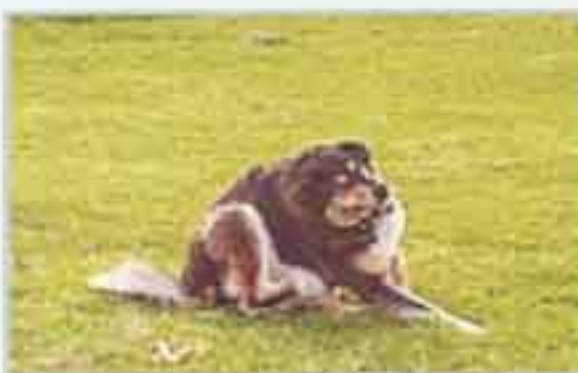
Situaciones con prurito en general