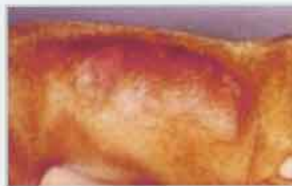
Alopecia de la piel con alopecia por uso continuado de corticoides

2. Vitamina A (retinol, 30 ´ 000 U.I) para el tratamiento de las dermatosis que responden a la vitamina A, típica de Cockers y Labradores, y caracterizada por hiperqueratosis oclusiva de los folículos y seborrea grasa.