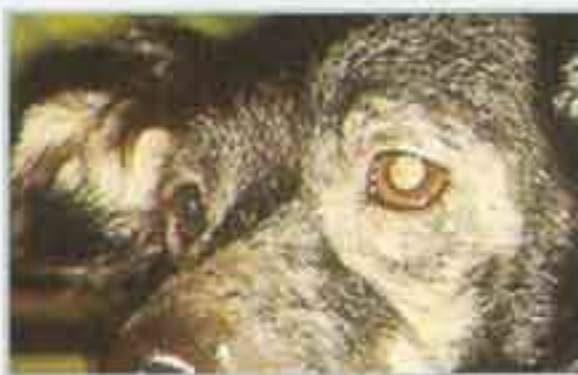
Alergia alimentaria con prurito facial y en las patas