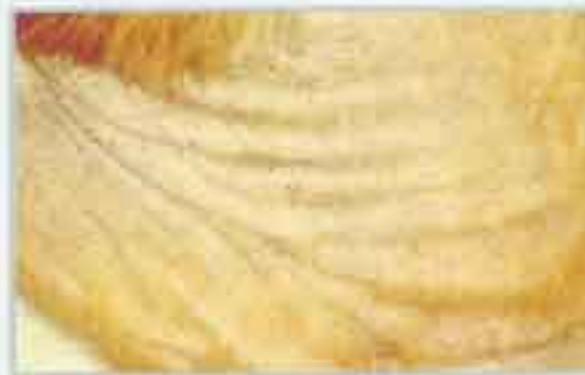
Dermatitis alergica a la picadura de pulga