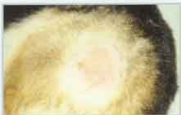
Mostrando (hot spot) por trauma auto-inflicido

1. Acidos grasos esenciales \Omega 3, apenas los mas eficaces: EPA (11,8g) y DHA (7,7g). Estos son los unicos con efecto anti-inflamatorio puro. Especialmente eficaces en el protocolo de control de situaciones de atopia, DAPP, alergias por contacto, otras situaciones pruriginosas, piodermas y caida anormal de pelo.