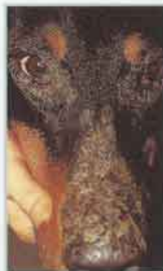
Aspecto mas comun de la dermatosis con respuesta al Zn I (adultos)